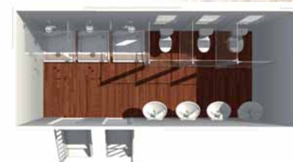
Baños con Duchas